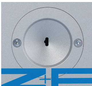
Spezial Einführtrichter Special feeding funnel

Ein zwei-adriges und ein drei-adriges Kabel abisoliert mit der AI 02 S3 in nur einem Schritt. A two wire conductor and a three wire conductor stripped with the AI 02 S3 in just one step.