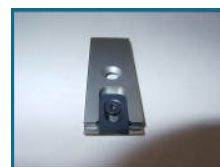
Flachmesser mit Zentrierer