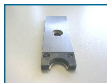
Düsenmesser mit Zentrierer