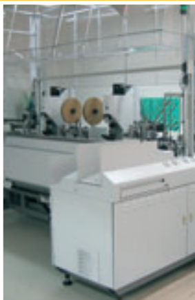
Masina de sertizare complet automatizata Zeta 633