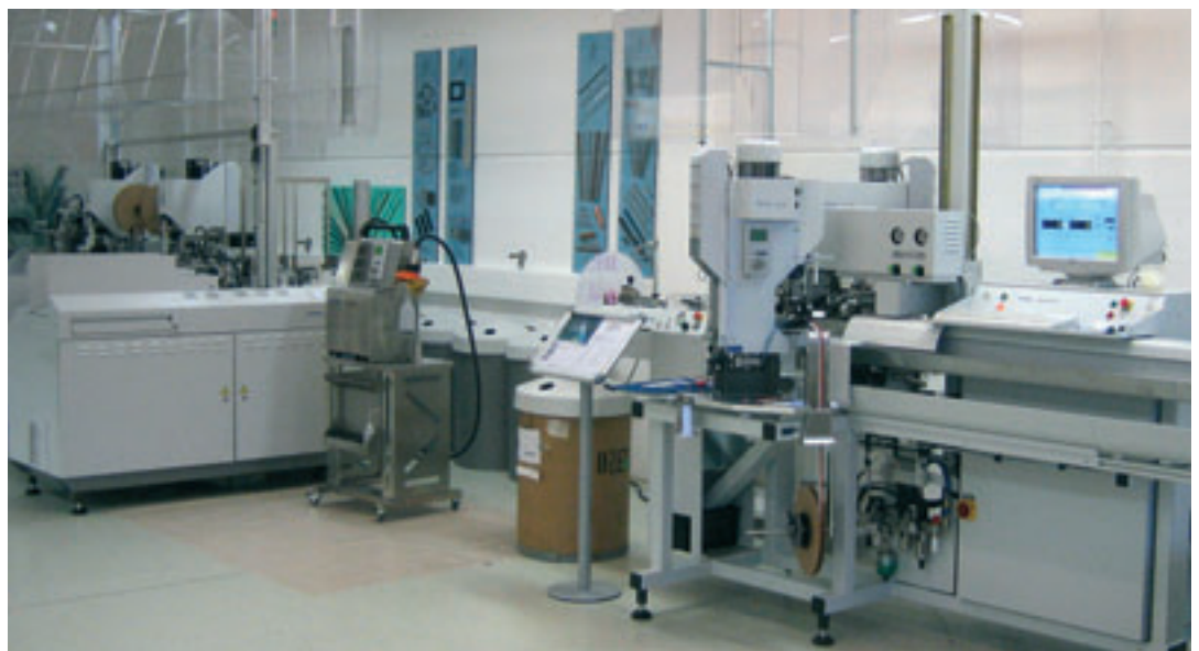
Zeta 633 si Gamma 333 PC in sala de prezentare la Thonauer

In continuarea workshop-ului specialistii EPLAN si Thonauer au stat la dispozitia vizitatorilor interesati pentru a raspunde la intrebari, realizandu-se cu unii vizitatori deja discutii de proiecte concrete detaliate. Cu placere vom raporta si in editiile viitoare ale revistei noastre despre evolutiile ulterioare in domeniu. Ne-ar bucura sa avem posibilitatea sa prezentam rapoarte detaliate asupra unor proiecte concrete realizate, similare cu cel publicat recent in editia XV (utilizarea unei masini Zeta 633 la GE Jenbacher)