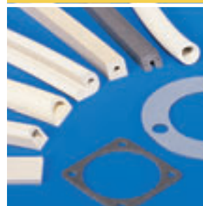
Garnituri textile electro-conductive (Fabric over Foam)